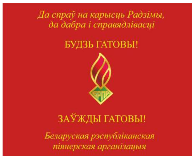
Знамя областной (Минской городской) пионерской организации (лицевая сторона)