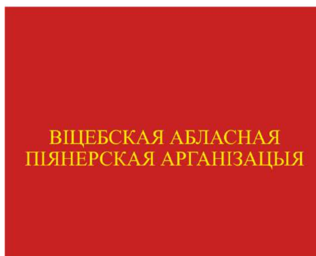
Знамя областной (Минской городской) пионерской организации (оборотная сторона)