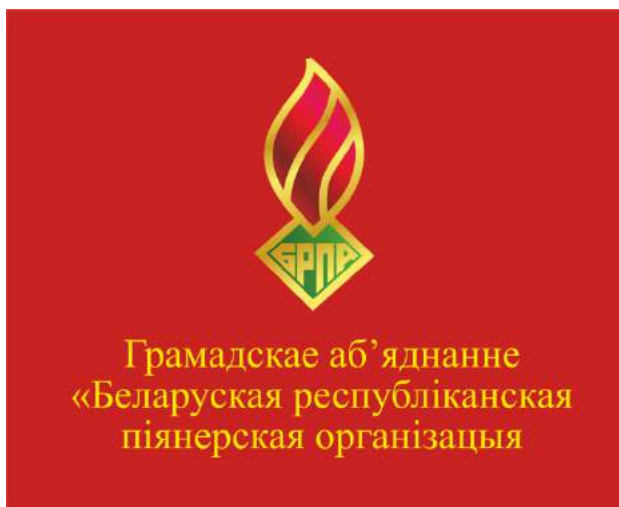
Знамя ОО «БРПО» (лицевая сторона)