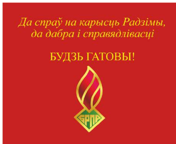
Знамя ОО «БРПО» (оборотная сторона)