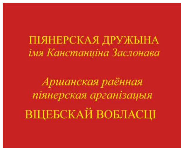
Знамя пионерской дружины (оборотная сторона)